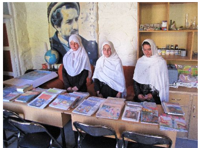
Des lycéennes et les livres offerts par NEGAR