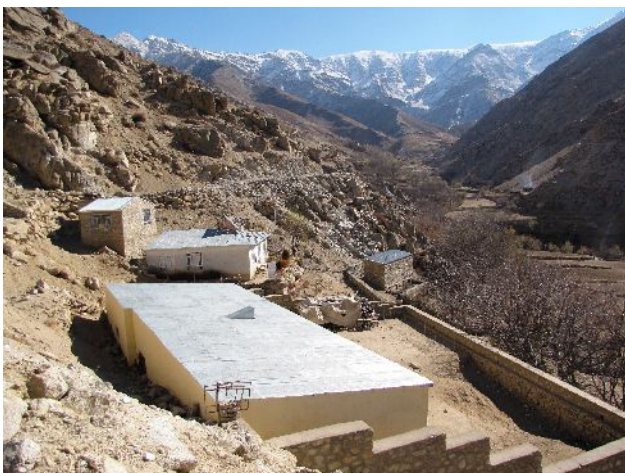
Le collège de filles de Koh-Manjaour NEGAR

NEGAR a fait faire des étagères par un menuisier et les a installées dans la réserve pour le rangement des livres qui étaient tous par terre.