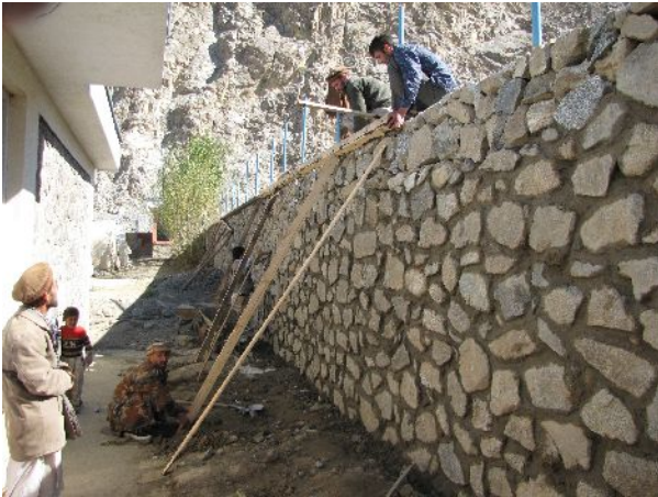
La reconstruction est presque achevée

Mais le responsable de nos travaux de construction d'écoles, un ancien moudjahid de Massoud, y est allé (avec une kalachnikov) et a réussi la reconstruction et la consolidation du mur d'enceinte détruit par un glissement de terrain au printemps.