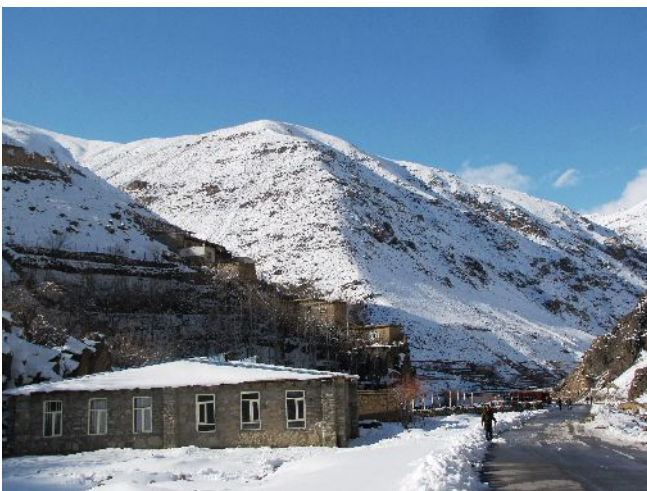
Le lycée de filles de Tambana

Les travaux de réparation (peinture, pose des portes et fenêtres) sont maintenant terminés et NEGAR a fait don de plus d'une centaine de livres à la bibliothèque.