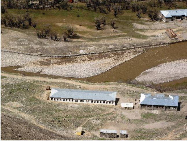
A droite, le lycée de filles de Badqol