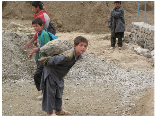
Tous les élèves ont participé à la reconstruction

NEGAR a aussi pu louer une voiture pour emmener chaque jour 10 professeurs auxiliaires au Centre de Formation des Maîtres de Khenjan ( grâce aux parrainages ).